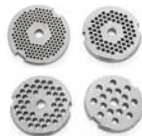
Lochscheiben 2,5 / 4,5 / 6 / 8 mm ⓑ