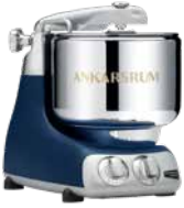
AKM6230 RB Royal Blue Matt