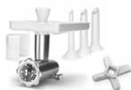
Fleischwolf Basispaket (Messer & Wurstfüllaufsätze, 10 / 20 / 25 mm) ⓑ