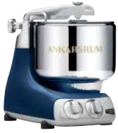
AKM6230 OB Ocean Blue Hochglanz Metallic