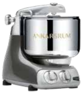
AKM6230 BC Black Chrome Hochglanz Metallic