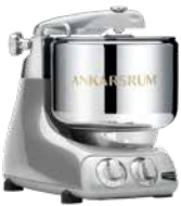
AKM6230 JS Jubilee Silver Hochglanz Metallic