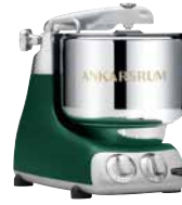
AKM6230 FG Forest Green Matt