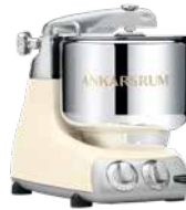
AKM6230 LC Light Crème Hochglanz