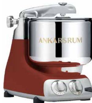
AKM6230 RM Rustic Maroon Matt