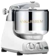
AKM6230 MW Mineral White Matt