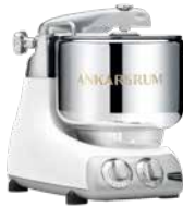
AKM6230 GW Glossy White Hochglanz Metallic