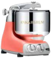
AKM6230 CC Coral Crush Matt