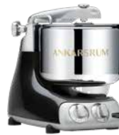
AKM6230 BD Black Diamond Hochglanz Metallic