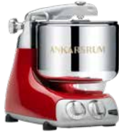
AKM6230 R Red Hochglanz Metallic