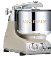
AKM6230 HB Harmony Beige Matt