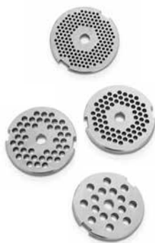
Edelstahl Lochscheiben 2,5 / 4,5 / 6 / 8 mm.