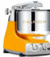
AKM6230 SB Sunbeam Yellow Matt