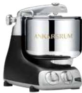
AKM6230 B Black Matt